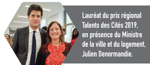
Lauréat du prix régional Talents des Cités 2019, en présence du Ministre de la ville et du logement, Julien Denormandie.

« Le handicap psychique est la conséquence de troubles psychiques (schizophrénie, la bipolarité, des troubles anxieux et dépressifs, des TOC...) limitant l'activité et la participation sociale et professionnelle. Il peut être associé à des troubles cognitifs, mais il n'implique pas de déficience intellectuelle. Ce sont des états psychologiques, temporaires ou permanents, plus ou moins sévères. Ils peuvent entraîner gêne, souffrance, perte de capacités ou problèmes comportementaux dans la vie quotidienne. » Source PSYCOM